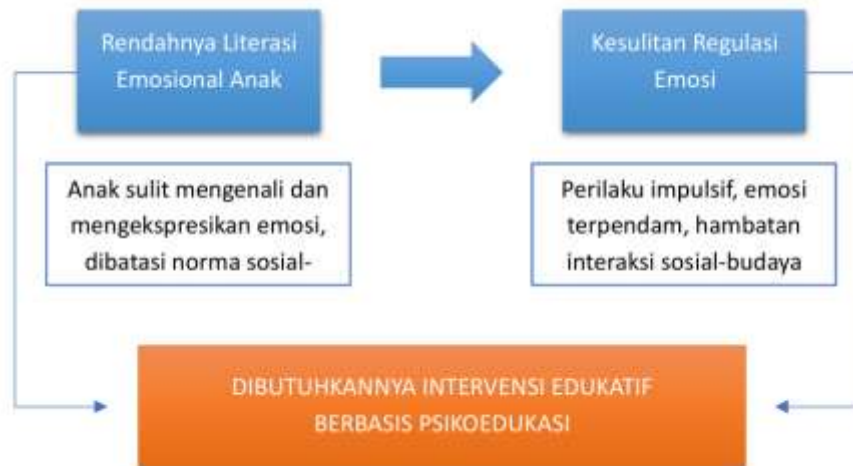
Gambar 2. Sekma permasalahan literasi emosional anak