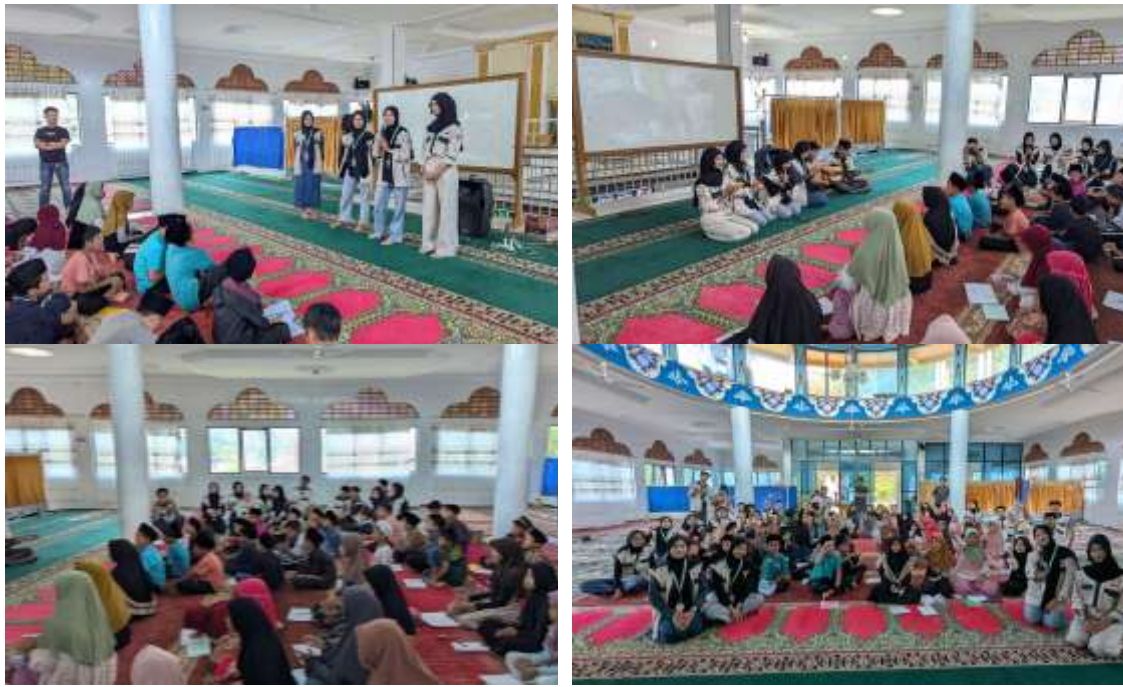
Gambar 4. Kegiatan Psikoedukasi