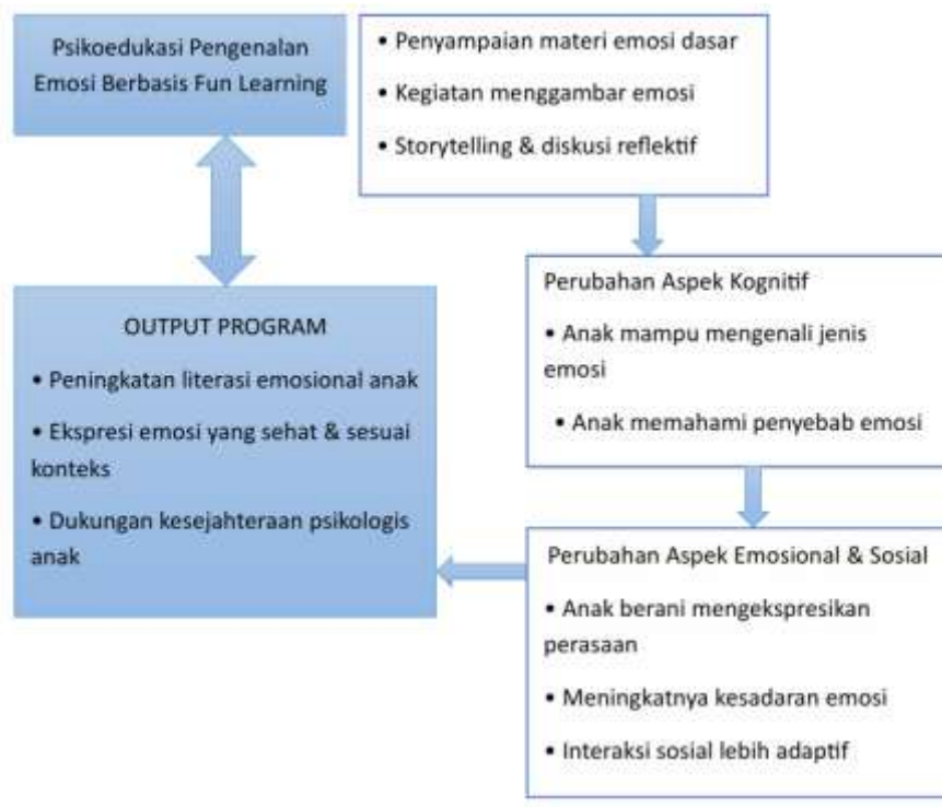
Gambar 3. Sekma solusi permasalahan melalui program psikoedukasi pengenalan emosi