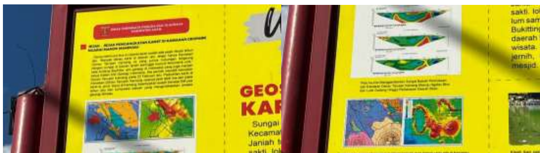
Gambar 3. Geosite yang menjadi objek pengembangan wisata edukasi

Melalui diskusi informal dengan penduduk setempat dan pengelola lokasi wisata, masyarakat memperoleh gambaran umum tentang potensi pengembangan pariwisata berbasis alam dan edukatif yang terkait dengan lokasi Ikan Sakti. Kegiatan ini meningkatkan pemahaman masyarakat tentang peluang pengembangan pariwisata dan membuka kemungkinan untuk kolaborasi dan partisipasi masyarakat di masa mendatang, mengikuti pendekatan Community-Based Tourism (Wicaksono et al., 2023).