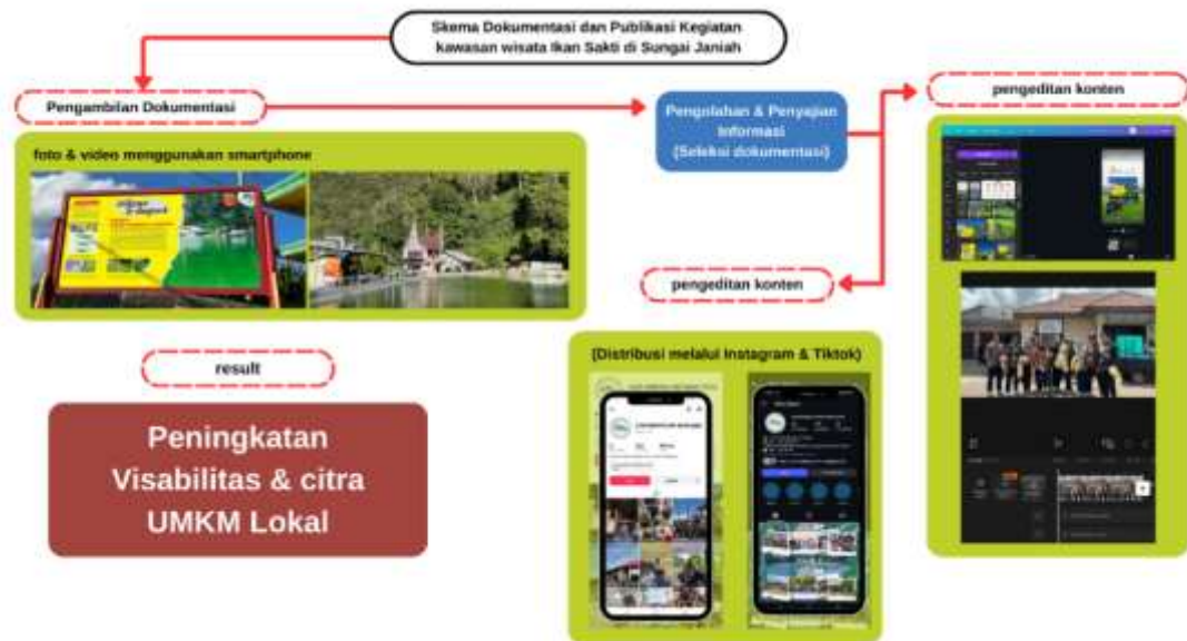
Gambar 2. Diagram alir proses penggunaan software untuk dokumentasi kreatif dan pemasaran digital