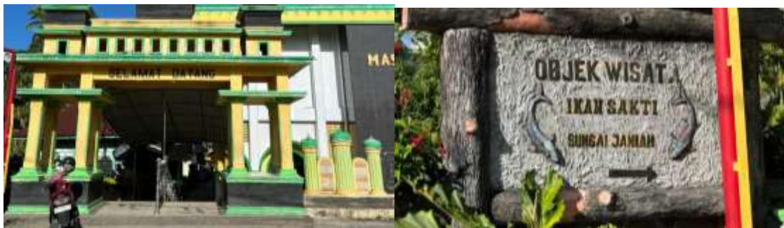
Gambar 4. Pintu masuk kawasan wisata yang menjadi titik awal observasi, merepresentasikan identitas lokasi dan potensi pengembangan fasilitas untuk mendukung daya tarik wisata setempat

Untuk lebih memperkuat hasil, implementasi program mendorong keterlibatan masyarakat yang lebih aktif dalam diskusi terkait potensi pariwisata dan pengelolaan lokasi. Selain itu, kegiatan pemetaan dan dokumentasi menghasilkan data terstruktur awal yang dapat mendukung penelitian di masa mendatang, proyek pengembangan pariwisata, atau inisiatif promosi digital tingkat lanjut ( Hakim et al., 2025 ), memastikan keberlanjutan di luar durasi program PkM.